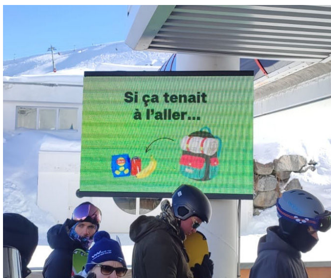
Photo prise au sommet de La Vizelle à Courchevel

Ce partenariat avec Lumiplan représente une réelle avancée dans notre lutte contre les déchets abandonnés. Nous avons l'opportunité de toucher chaque jour 20 millions de Français avec des messages de sensibilisation diffusés à grande échelle, et d'inciter chaque citoyen à faire un geste pour la planète, que ce soit sur les pistes de ski, dans la rue ou les transports publics. »